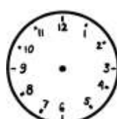
Wręczenie medali 13:00