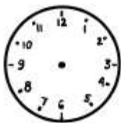
Skoki narciarskie 11:00